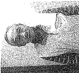
(今年もがんばるぞ!!)